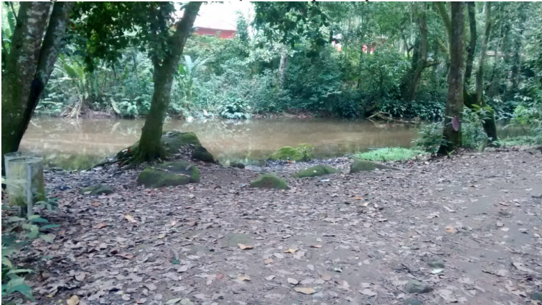
Figura 15: Local de realização da 1ª parada para discussão.