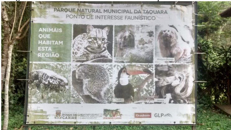
Figura 11: Placa informativa sobre a fauna que habita o PNMT.

fauna existente, que pode ser usada para falar sobre os animais. No entanto, vale lembrar que eles têm hábitos silvestres e, portanto, dificilmente serão vistos durante a aula.