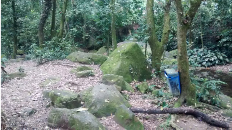
Figura 19: Local de realização da 3ª parada para discussão.