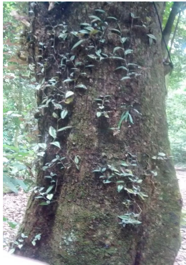
Figura 12: Zebrina ( Tradescantia zebrina Heynh) habitando tronco de árvore.

Desenvolve-se em áreas de temperaturas mais quentes e é considerada “planta daninha” na agricultura. Durante a trilha é possível observar uma numerosa população dessa espécie crescendo sobre o solo e também nos caules das árvores (epífitas acidentais).