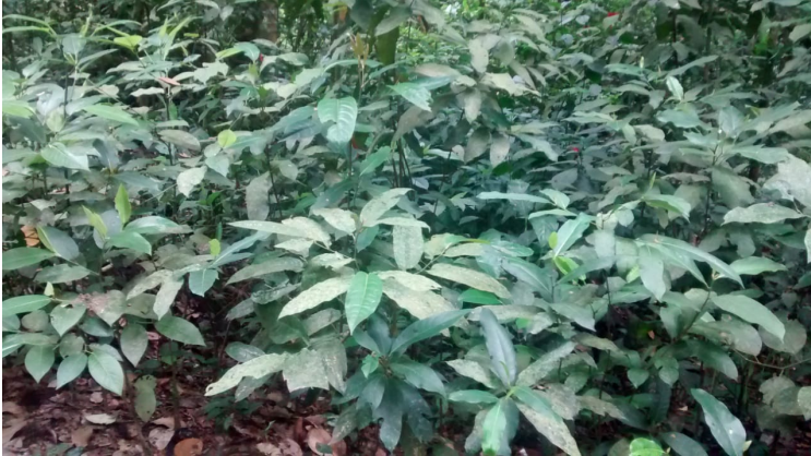
Figura 5: Folhas