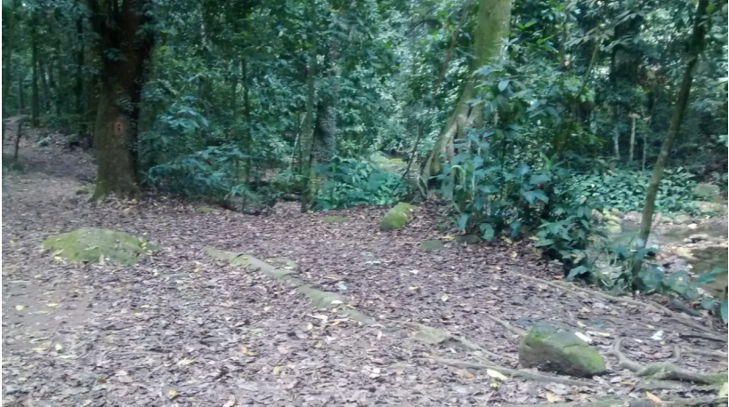
Figura 17: Local de realização da 2ª parada para discussão.