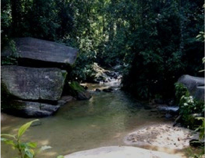
Figura 2: Poço da Pedra da Baleia, no Parque Natural Municipal da Taquara, localizado em Duque de Caxias, RJ.