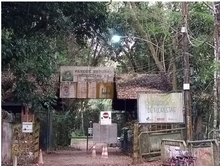
Figura 1: Portal de entrada do Parque Natural Municipal da Taquara, localizado em Duque de Caxias - RJ.