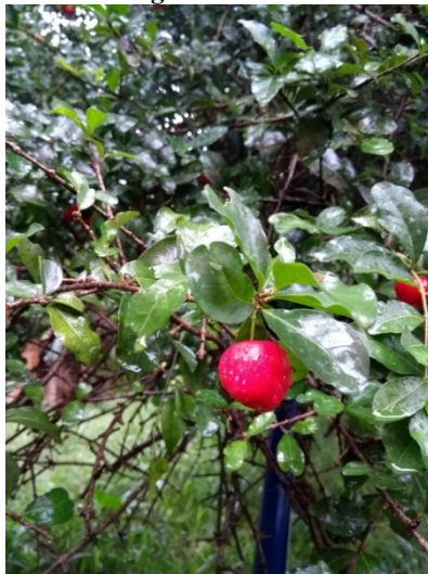
Figura 7: Fruto