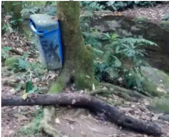
Figura 3: Raiz

Raiz (figura 3): Tem duas funções principais: fixar a planta ao solo e retirar água e sais minerais. Podem ser subterrâneas, aéreas ou aquáticas.