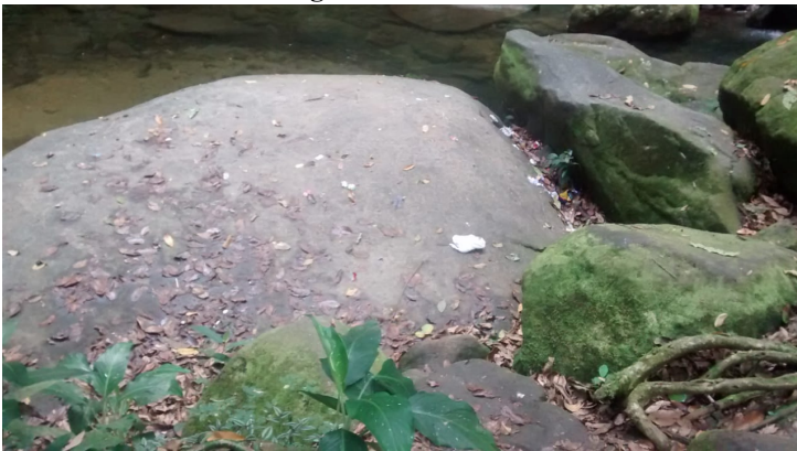
Figura 10: Rochas

As rochas magmáticas se formam por meio da solidificação do magma vulcânico. As sedimentares pela sedimentação de partículas que se acumulam e se consolidam. As metamórficas são formadas a partir da transformação de outra rocha.