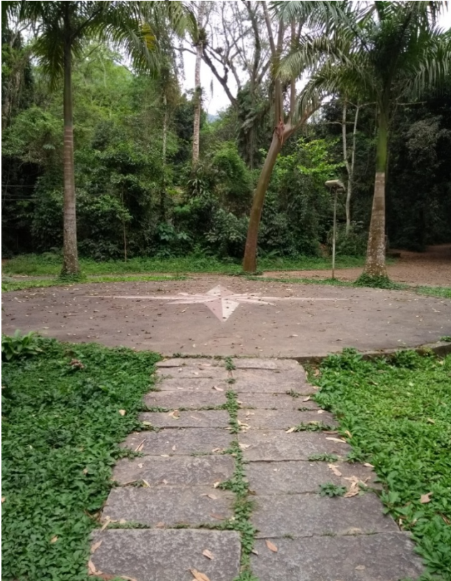
Figura 14: Espaço “Rosa dos Ventos”, localizado próximo à entrada do Parque Natural Municipal da Taquara, em Duque de Caxias - RJ.

Após este momento, os alunos percorrerão a trilha interpretativa para o Poço da pedra da Baleia. Serão realizadas três paradas para os momentos de discussão.