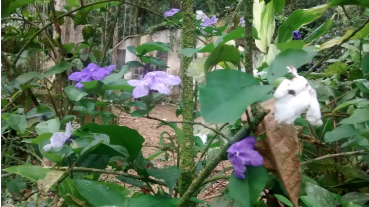
Figura 6: Flores