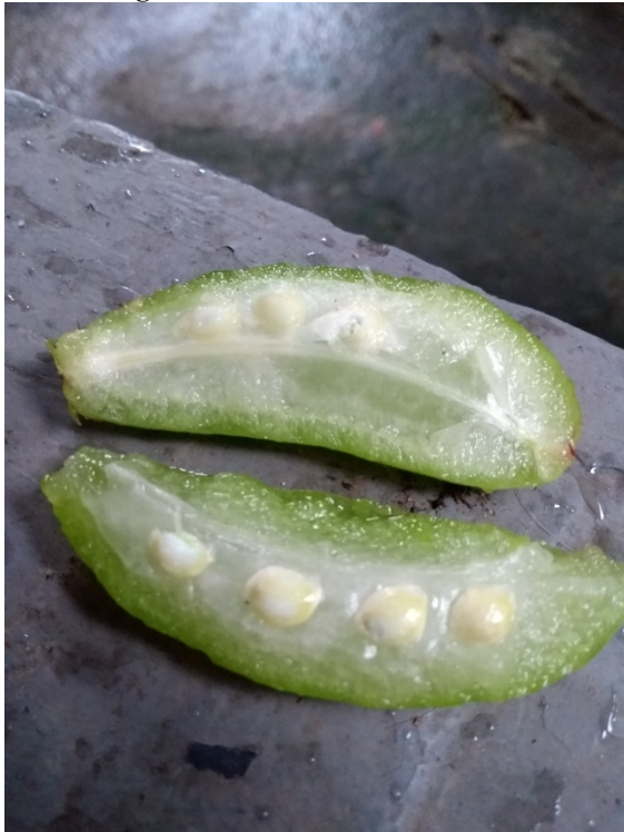
Figura 8: Sementes ainda no fruto

Semente (Figura 8): São os produtos da reprodução sexuada das plantas, através dela pode nascer um novo vegetal (MARTINS-DA-SILVA et al , 2014; RAVEN, 2007; NABORS, 2012)