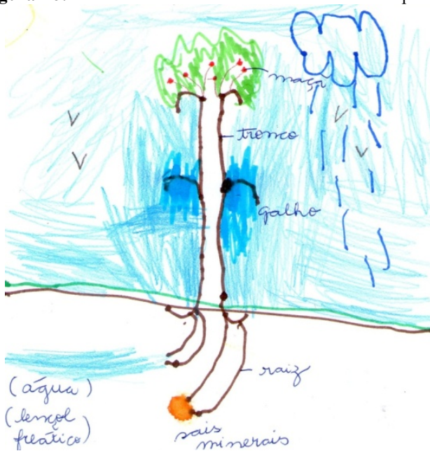
Figura 16: Desenho do aluno P retratando como é uma planta.

Para que servem as sementes? (Mostrar uma planta jovem ou alguma semente germinando). Como nascem as novas plantas? Como essa planta nasceu?