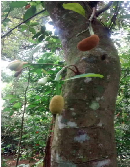
Figura 13: Frutos jovens da jaqueira ( Artocarpus heterophyllus Lam.), espécie invasora na Mata Atlântica