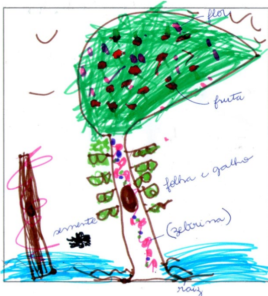
Figura 18: Desenho da aluna K retratando como é uma planta. Observa-se a zebrina ( Tradescantia zebrina Heynh) no caule da árvore.