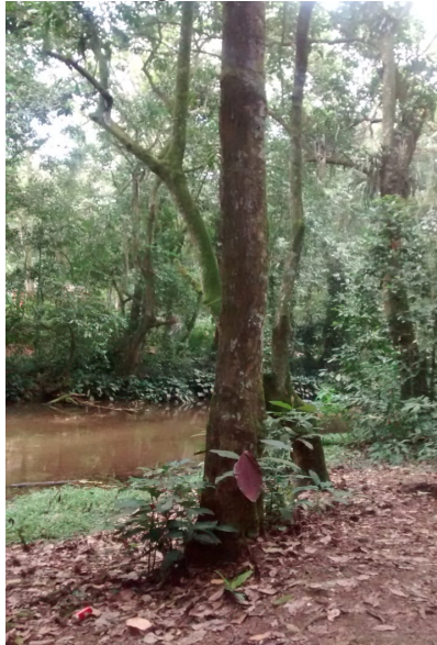
Figura 4: Caule

o peso das folhas e a força dos ventos. Geralmente é aéreo, mas existem também os subterrâneos e os aquáticos.