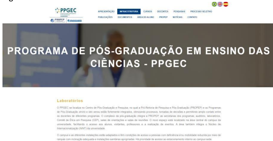
Figura 1. Site do PPGECS

Os principais documentos, como regulamento do curso, ementário, formulários, estão disponíveis neste espaço, assim como informações sobre o processo seletivo, dissertações e produtos educacionais (todos em pdf), infraestrutura, docentes, notícias e o acesso ao Portal do Aluno (Fig. 2 e 3). O site está traduzido para a língua inglesa e espanhola. É um ambiente multifuncional de gerenciamento de atividades acadêmicas da UNIGRANRIO.