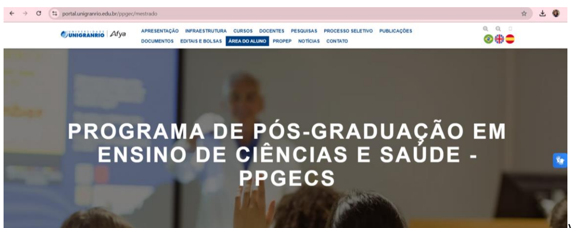
Figura 2. Imagem da página do PPGECS com indicação para o acesso ao Portal do aluno.

Os principais documentos, como regulamento do curso, ementário, formulários, estão disponíveis neste espaço, assim como informações sobre o processo seletivo, dissertações e produtos educacionais (todos em pdf), infraestrutura, docentes, notícias e o acesso ao Portal do Aluno (Fig. 2 e 3). O site está traduzido para a língua inglesa e espanhola. É um ambiente multifuncional de gerenciamento de atividades acadêmicas da UNIGRANRIO.